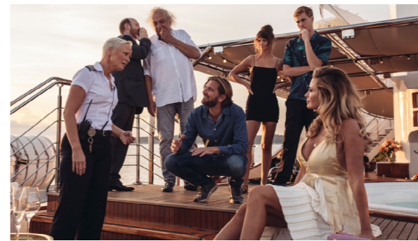
Met de klok mee: The Menu (2022), Succession (2023), Triangle of Sadness (2022), The White Lotus (2022).